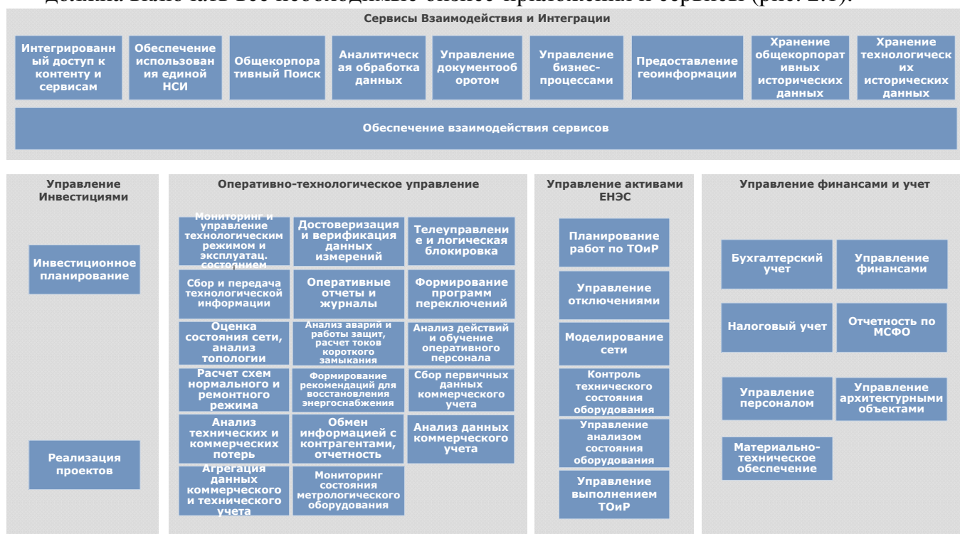
Рис.2.1. Корпоративная информационная система управления

В целях обеспечения высокого уровня надежности и эффективности ЕНЭС посредством своевременного и качественного решения задач Общества КИСУ должна включать все необходимые бизнес-приложения и сервисы (рис. 2.1).